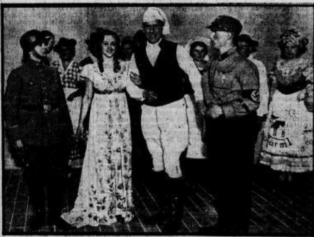
Aufklärung durch Theater. Im Rahmen der großen Landwirtschaftsausstellung, die jetzt in Berlin eröffnet wurde, wird in einem Dorftheater ein lustiges Märchenpiel vom Volkswirtschaftlichen Aufklärungsdiener gezeigt, aus dem unser Bild eine Szene wiedergibt.