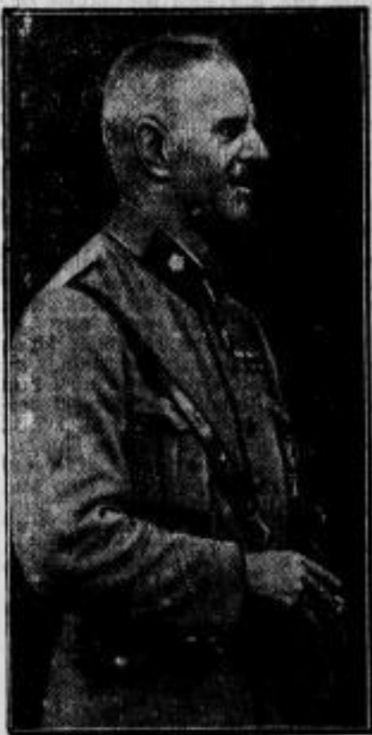
Der Erstürmer des Annaberges. Unsere Aufnahme zeigt Hauptmann Desterreicher, der vor 12 Jahren mit oberschlesischen Selbstschutzkämpfern den von den Polen besetzten Annaberg stürmte.