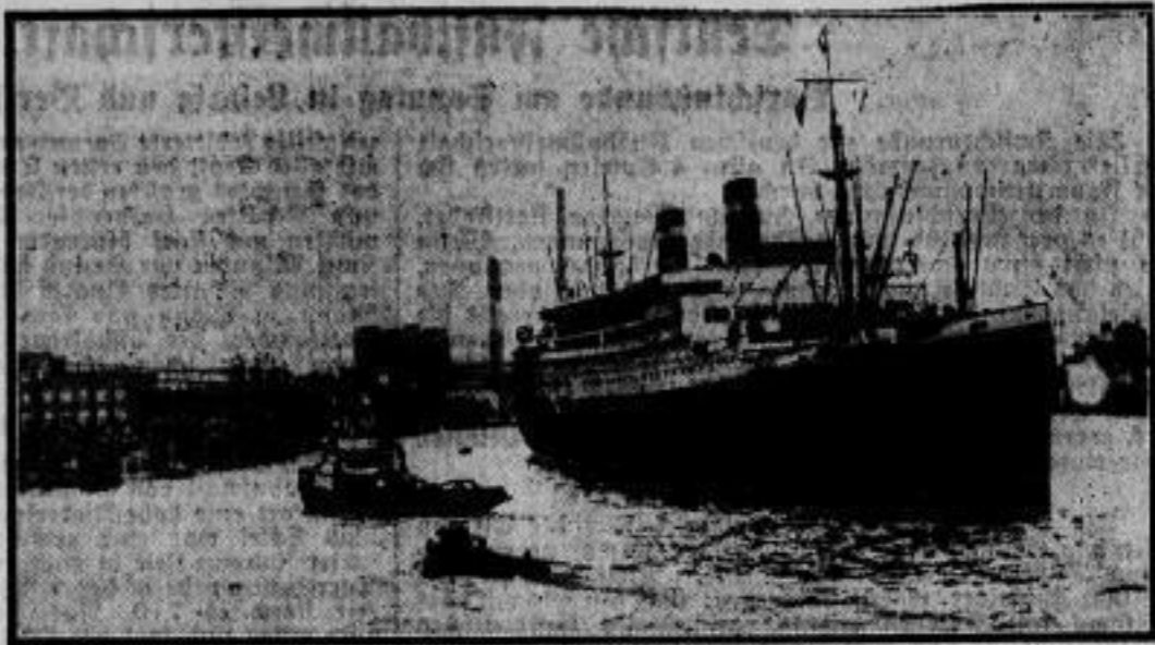
Der größte amerikanische Dampfer in Hamburg. Auf seiner Jungfernfahrt ist der größte amerikanische Passagierdampfer, „Washington“, im Hamburger Hafen eingetroffen. Der neue amerikanische Luxusdampfer hat eine Größe von 30 000 Tonnen.