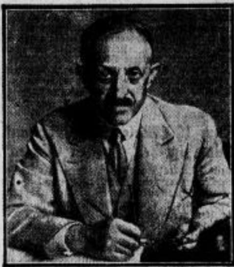
Der Organisator der Weltwirtschaftskonferenz. Alfred Hershey, Mitglied des Völkerbundes, ist der verantwortliche Leiter für die Organisation der Weltwirtschaftskonferenz, die im nächsten Monat abgehalten werden soll.