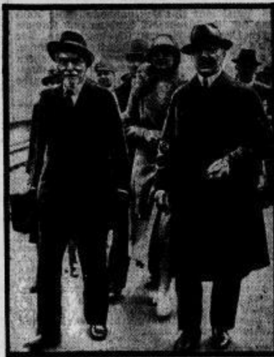
Reichsbankpräsident Schacht und Montague Norman. Reichsbankpräsident Dr. Schacht wurde bei seiner Ankunft in London vom Präsidenten der Bank von England, Montague Norman (links), persönlich bewillkommen.