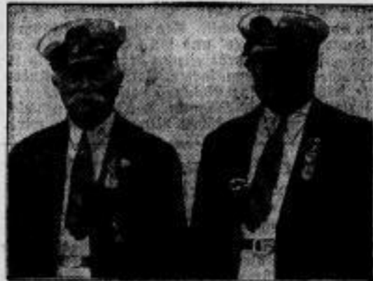
Bundesführer Schlud zum Präsidenten des Reglers Weltverbandes gewählt. Auf der Tagung des Internationalen Regler-Sport-Verbandes, die anlässlich des 18. Deutschen Bundesfestes in Frankfurt am Main abgehalten wurde, wählte man den deutschen Bundesführer Paul Schlud-Bauer (rechts) einstimmig zum neuen Präsidenten. Der bisherige Präsident Joe Thum-Kempport (links neben ihm) ist zum Ehrenpräsidenten ernannt worden.