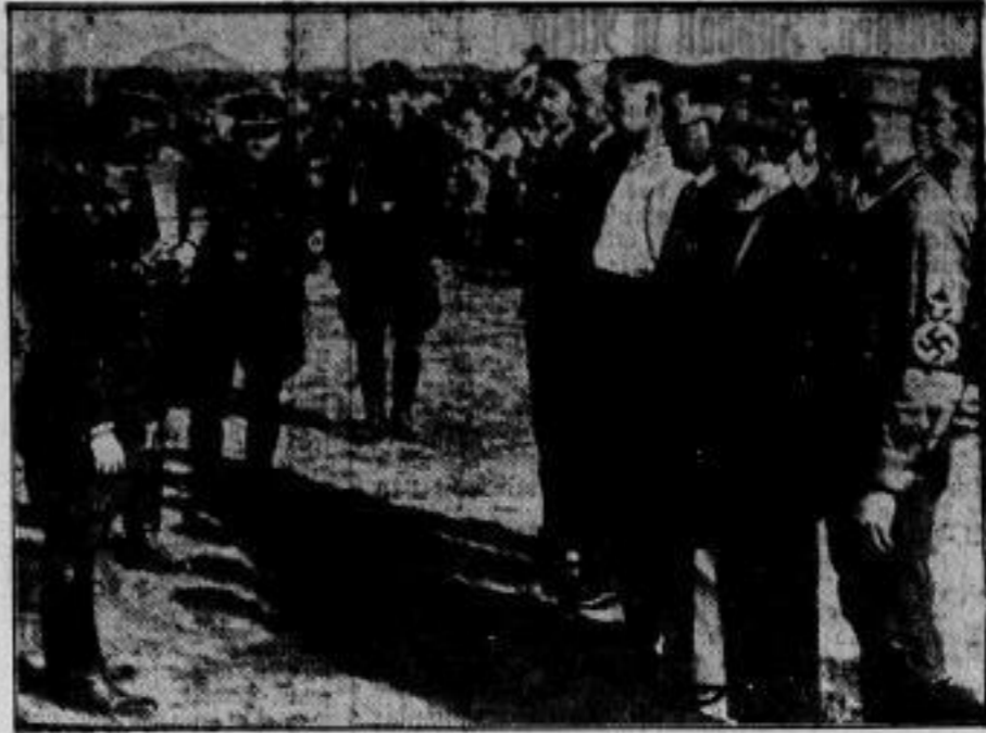
Ostpreußens letzte Arbeitslose. Der ostpreussische Kreis Pillkallen kann sich rühmen, keine Arbeitslosen mehr zu zählen — mit Ausnahme dieser Herren. Es sind nämlich die Beamten des Arbeitsamtes, die nun durch das Ende der Arbeitslosigkeit selbst arbeitslos geworden sind und hier vom Oberpräsidenten Koch für ihre jahrelange mühevollte Arbeit bedankt werden.