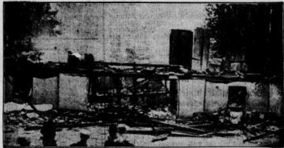
Das niedergebrannte Tiroler Passionsspieltheater in Erl. Das bekannte Tiroler Passionsspieldorf Erl in der Nähe der bayerischen Grenze ist von einem schweren Unglück heimgesucht worden: das im Stil der Tiroler Bauernhäuser errichtete Passionsspieltheater, das auf eine 800jährige Tradition zurückblicken kann, wurde durch ein Schandfeuer vollkommen vernichtet.