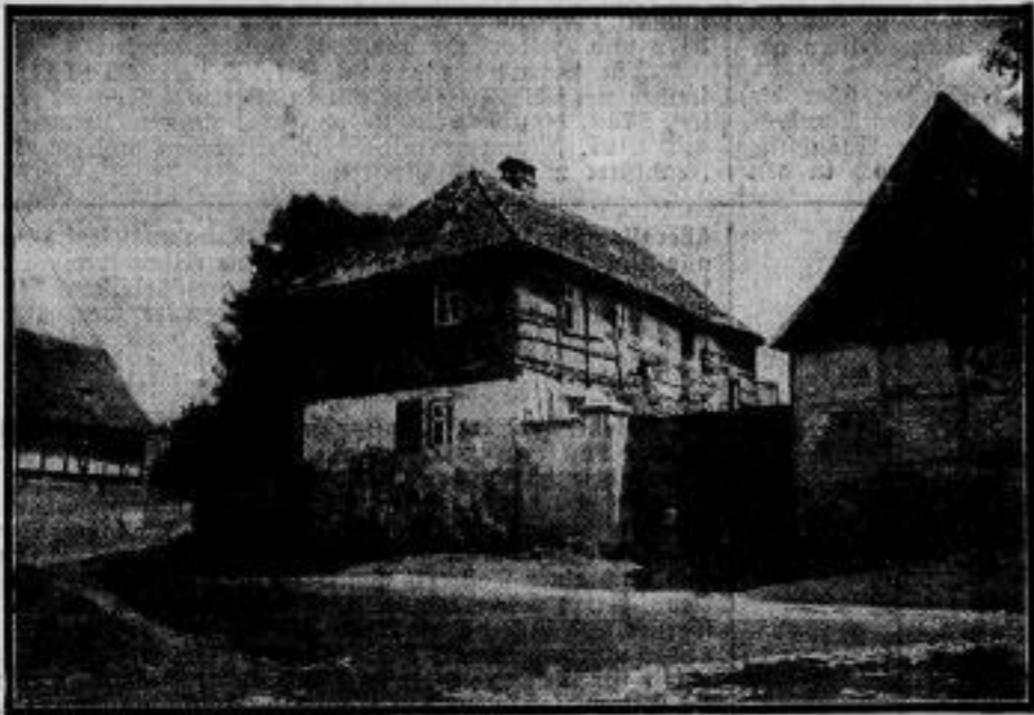
Das deutsche Bauernhaus. Garzer Gehöft in Nieder bei Ballenstedt, das auf einem massiven Unterbau in Fachwerk ausgeführt ist.