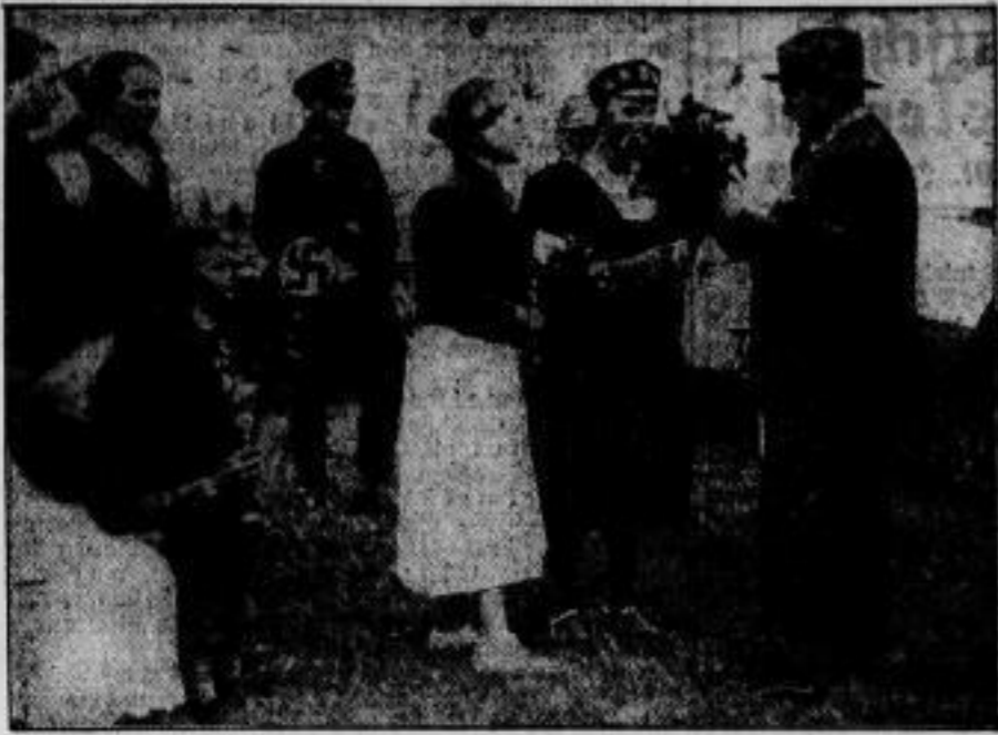
Ministerpräsident Göring erhält sich auf Spitz. Unser Bild schildert die Begrüßung des preussischen Ministerpräsidenten Göring durch eine Fräulein im Nationalsozialismus und durch ein Hitlermädel bei seiner Ankunft auf der Insel Spitz, wo er einen kurzen Erholungsurlaub nehmen will.