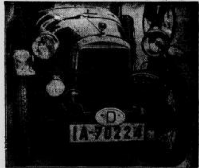
Das Abzeichen der 2000-Kilometer-Fahrer. Die Teilnehmer der arduen 2000-Kilometer-Fahrt durch Deutschland führen diese Erkennungsabzeichen an ihren Bogen und Motorrädern.