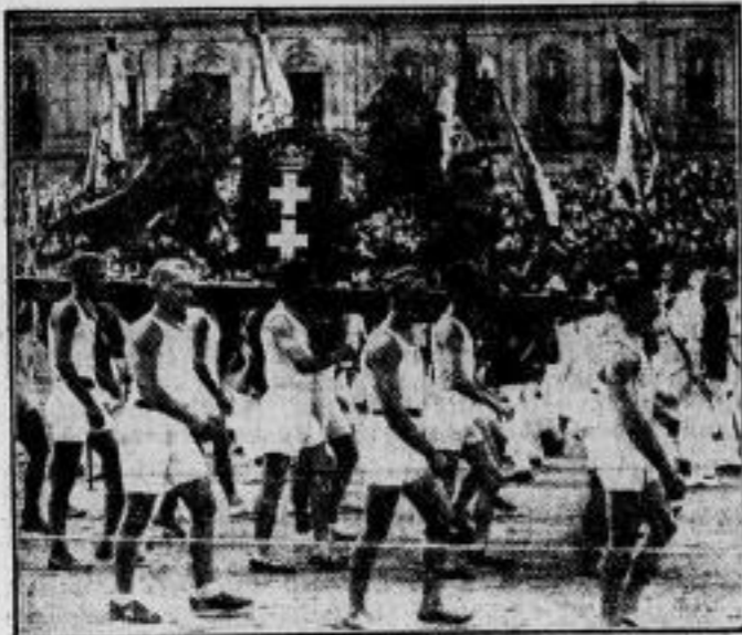
Das Danziger Wappen im Festzuge. In dem großen Festzuge, der zum Abschluss des Deutschen Turnfestes veranstaltet wurde, fand das Wappen der Freien Stadt Danzig besondere Beachtung.