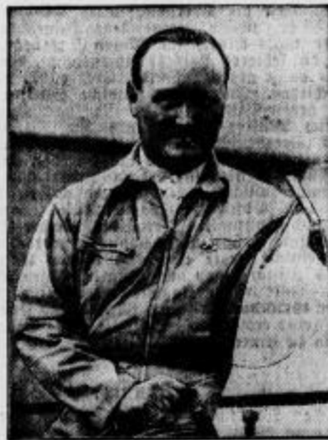
Weltrekordfahrer Graf Czajkowski tödlich verunglückt. Beim Automobilrennen um den Großen Preis von Monza ereigneten sich mehrere Todesfälle. Unter den Opfern befindet sich auch der in Deutschland durch seine Erfolge auf der Berliner Avus bekannte französische Rennfahrer Graf Czajkowski, den wir hier an seiner Maschine zeigen.