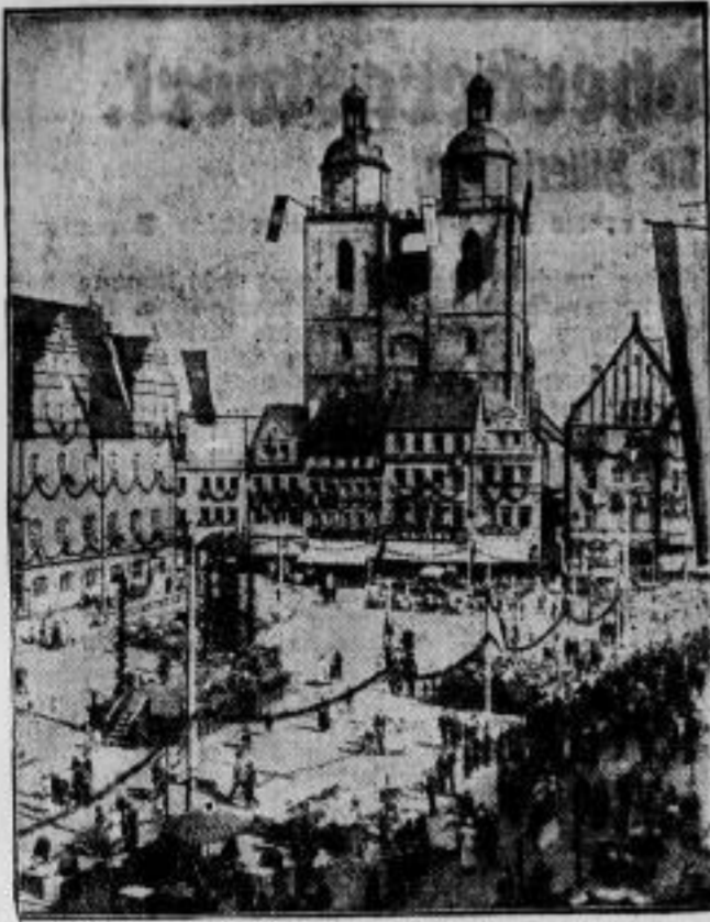
Wittenberg im Flaggenschmuck. Ein Bild auf die zu den Luther-Festtagen festlich geschmückte Stadt mit dem Markt und der Stadtkirche.