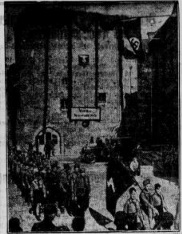
Hier wurde die erste deutsche Bauernhochschule eröffnet. In diesem ehemaligen Kloster in der alten märkischen Stadt Gransee wurde die erste deutsche Bauernhochschule und Bauernführerschule ihrer Bestimmung übergeben.