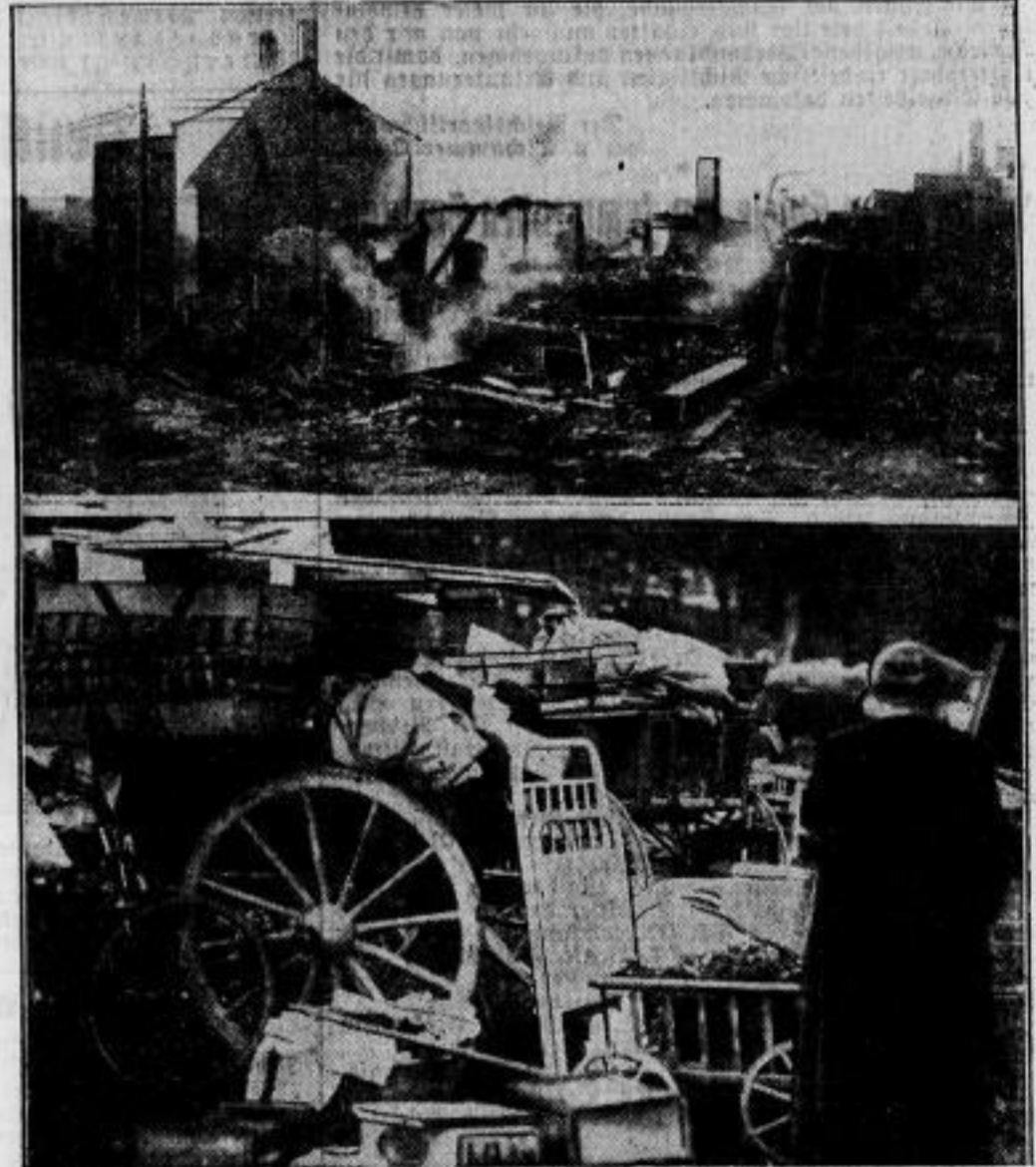
Unser Bild oben gibt einen Blick auf einen Teil der vollkommen abgebrannten Häuser in Döschelbronn — unten sieht man Einwohner mit ihrer geretteten Habe in den Straßen der heimgesuchten Stadt.