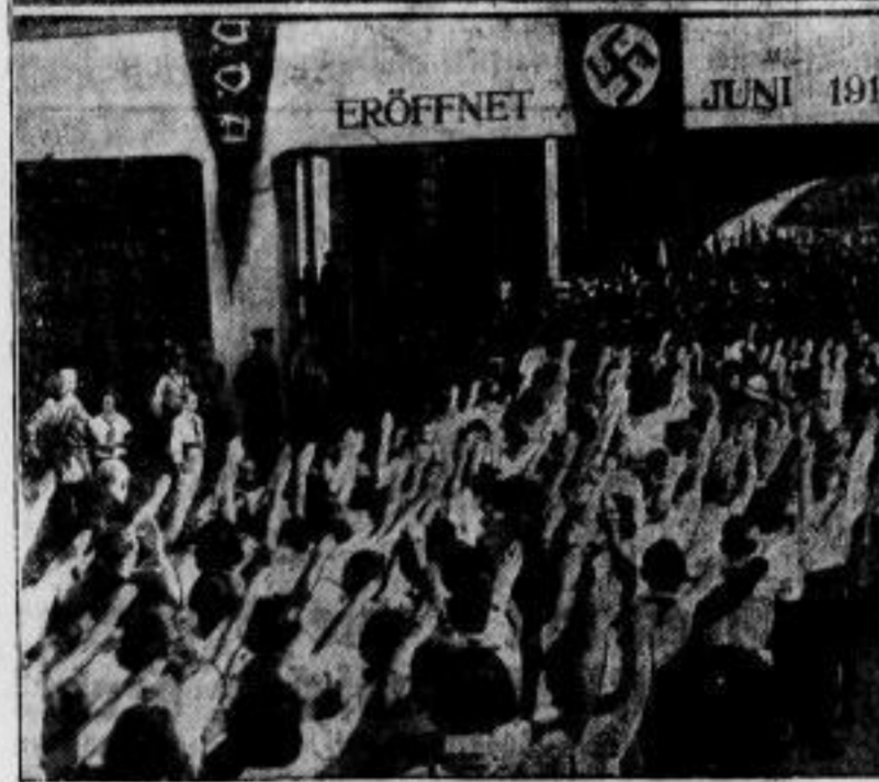
Vom Fest der Deutschen Schule. das im Berliner Brunnenwald-Stadion sich zu einer machtvollen Kundgebung für die Auslandsdeutschen und für das neue Deutschland gestaltete: (oben) Bischof Müller von Posen, Minister Dr. Goebbels und Oberbürgermeister Dr. Sahm grüßen von der Ehrenloge die Schuljugend beim Vorbeimarsch (unten).