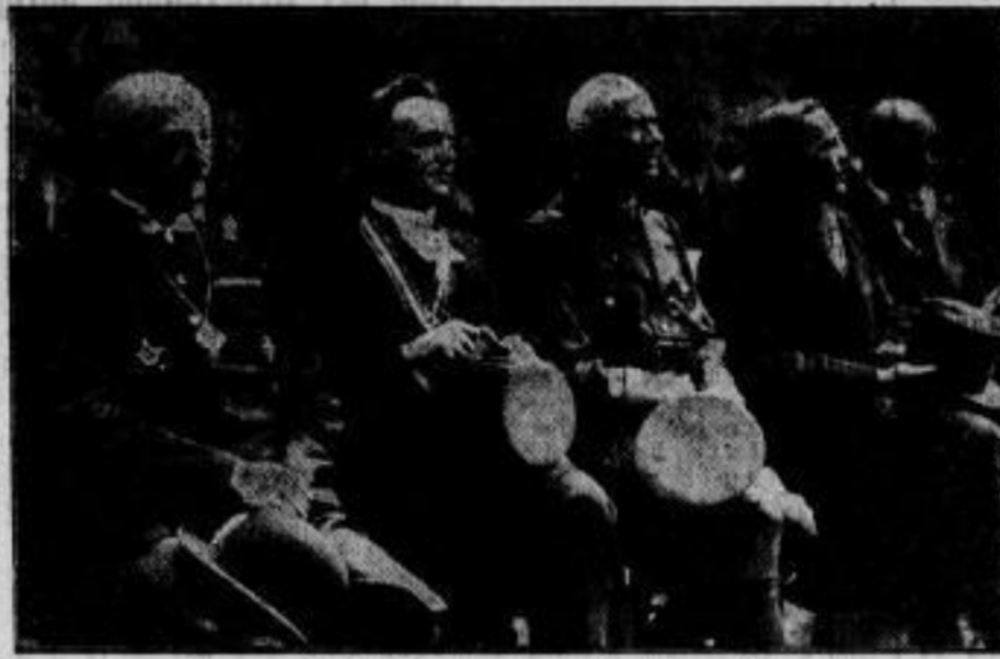
Bekannte Persönlichkeiten bei der Eröffnungsfest. Wir geben hier bekannte Persönlichkeiten während des großen Festes der Lutherfeier im Lutherhof in Wittenberg wieder: (von links) Landesbischof Müller — Dr. Eidem, der Erzbischof von Upsala — Reichsinnenminister Dr. Frick — Reichsfinanzminister v. Schwerin-Krosigk.