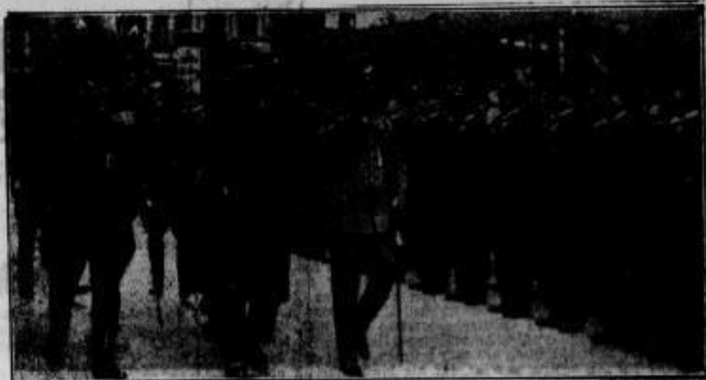
Ehrenpräsident Reichskriegsbund Im Bundeshaus des deutschen Reichskriegerbundes Anführer wurde der neue Ehrenführer des Bundes, Reichskriegsbund General Ritter von Epp (in Zivil) durch den Bundesführer, General a. D. von Horn, (neben ihm) feierlich eingeführt.