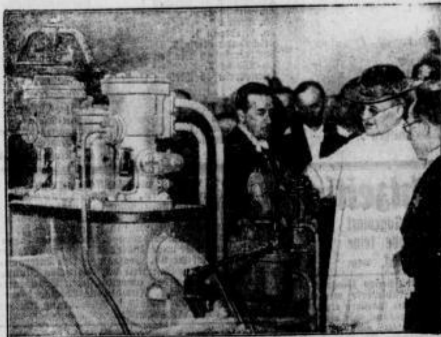
Der Papst weiht die neue Zentralheizungsanlage im Vatikan. Auch der Vatikanstaat wird ständig modernisiert und hat jetzt sogar eine Zentralheizungsanlage erhalten, die bei ihrer Inbetriebnahme vom Heiligen Vater persönlich geweiht und besichtigt wurde, wie unser Bild hier wiedergibt.