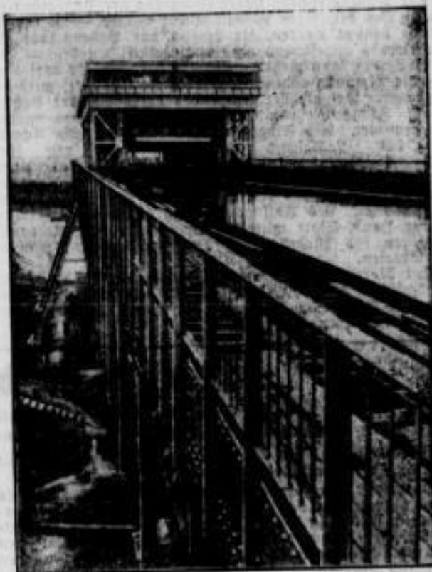
Schiffhebewerk Niederflinow nahezu fertiggestellt. Unsere neueste Aufnahme des riesigen Schiffhebewerkes Niederflinow bei Berlin zeigt, daß die Bauarbeiten nahezu beendet sind. Wie man sieht, ist hier der große Troch zur Beförderung der großen Schiffe bereits von Wasser gelassen.