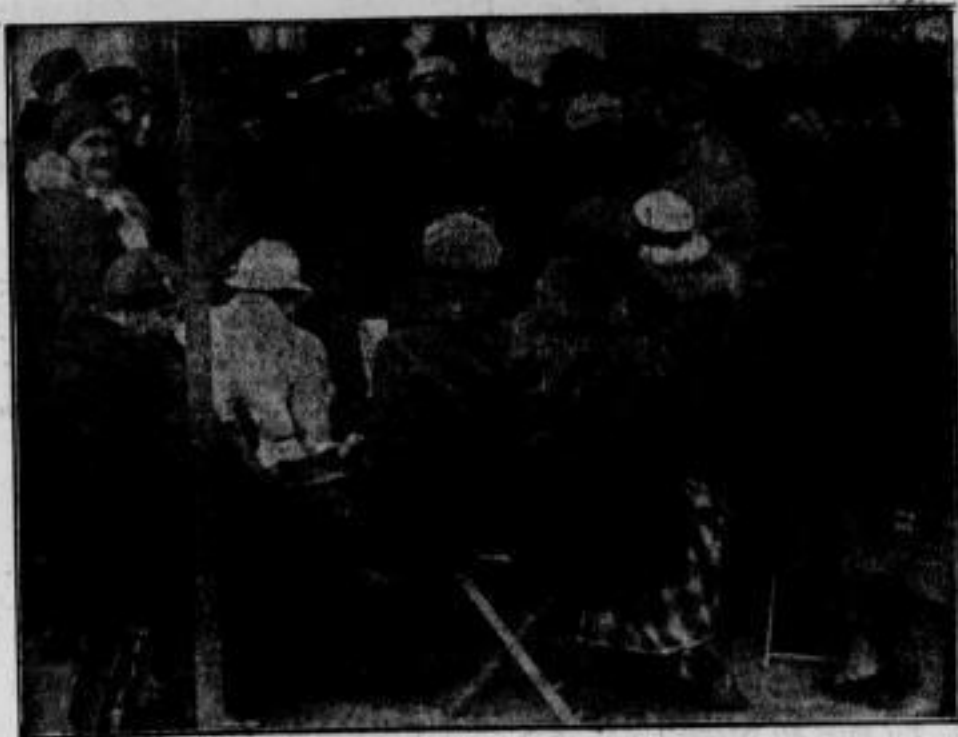
In Erwartung der Kanzlerrede. Ein schönes Beispiel der Begeisterung des Volkes für den Kanzler gibt diese Aufnahme: noch am Vormittag, mehr als acht Stunden vor der Rede, haben sich die ersten Zuhörer in der Potsdamer Straße in Berlin eingefunden, um Eintritt in den Sportpalast zu erhalten, wo der Kanzler seine große Wahlrede an das deutsche Volk hielt.