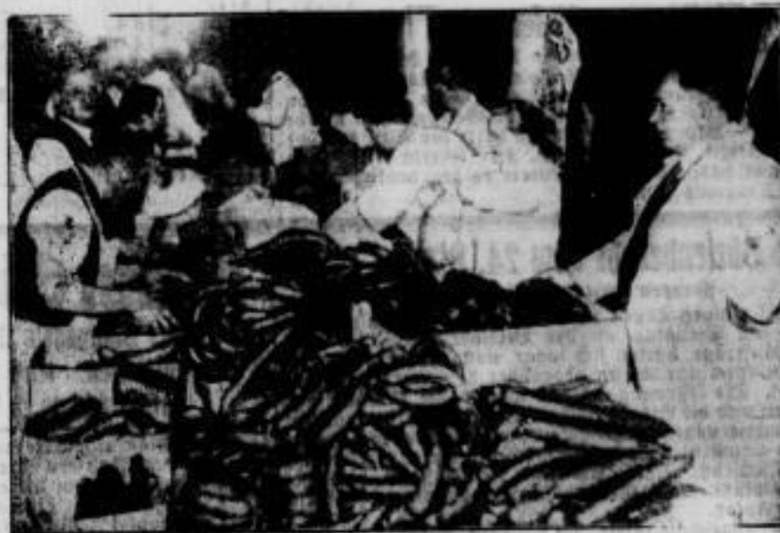
Auch die Berliner Fleischer haben für die Winterhilfe. Die Fleischer der Reichshauptstadt veranstalteten von sich aus eine Sammlung für die Winterhilfe, bei der über 70 000 Pfund Speck und Wurst zusammenkamen und die hier an bedürftige Volksgenossen verteilt werden.