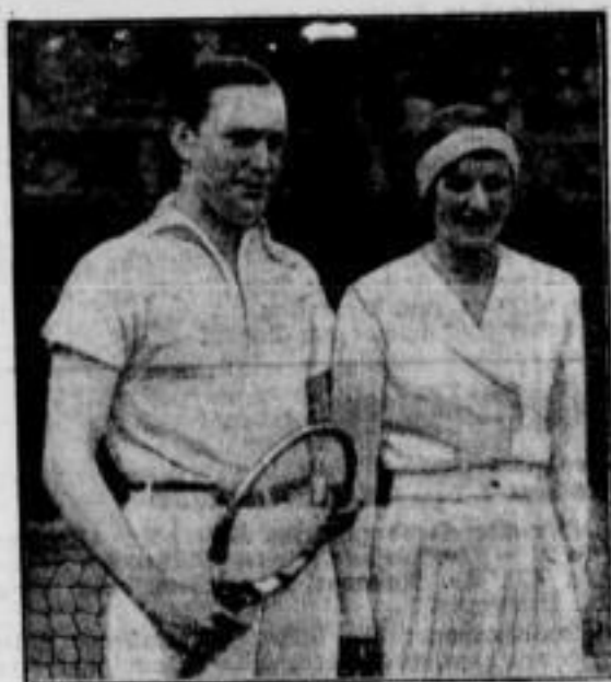
An der Spitze der Deutschen Tennis-Mannschaft. An der Spitze der Deutschen Tennis-Mannschaft, die jetzt der Deutsche Tennis-Bund aufstellt hat, stehen bei den Herren Gottfried von Gramm-Berlin, bei den Damen die deutsche Meisterin Hilde Krahwinkel-Olsen.