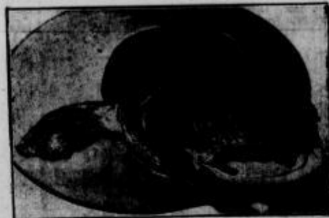
Ein Wuchtgewicht Wessen Anglerherz schlägt nicht höher, wenn er diesen präparierten Kopf eines 101 Pfund schweren Welses sieht? Dieser kapitale Fische wurde vor einigen Jahren bei Potsdam gefangen und ist gegenwärtig auf einer Anglerausstellung in Berlin zu bewundern.