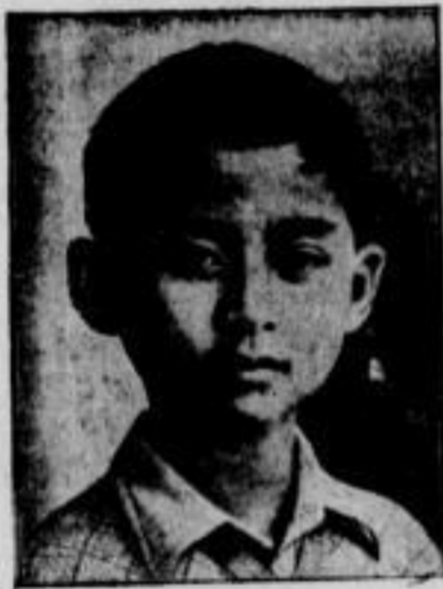
Siam neuer König Die Nationalversammlung von Siam hat den elfjährigen Neffen des vor kurzem abgedankten Königs, Prinz Ananda, gebeten, den Thron zu besteigen. Der Prinz hat hierzu seine Bereitwilligkeit ausgesprochen, jedoch wird bis zu seiner Mündigkeitserklärung ein Regentenschatral die Staatgeschäfte führen.