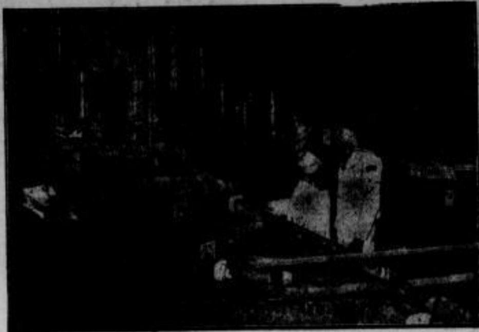
Vom Ausbau der Großen Berliner Wasserportanlage. Das Modellschiff Kreuzer „Hindenburg“ der Schiffmodellbauerschule Potsdam, das auch auf der Großen Berliner Wasserportanlage ausgestellt wird, findet hier von Angehörigen der Reichsmarine sachkundige Anerkennung.