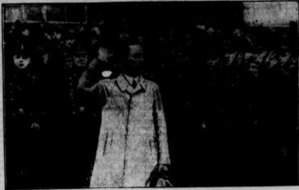
Reichsminister Dr. Goebbels besuchte die Leipziger Messe. Unser Bild berichtet von dem Besuch des Reichsministers Dr. Goebbels auf der jetzt eröffneten Leipziger Frühjahrsmesse: Dr. Goebbels wird bei der Ankunft von einer Ehrenabordnung der SM. begrüßt.