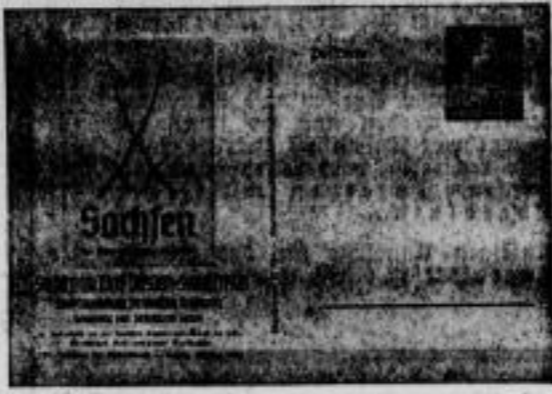
(Heimatwerk Sachsen - M.)

fen in seiner Eigenart und Vielfältigkeit zum Erklingen zu bringen und in der Zusammenfassung zum wuchtigen Arbeitsatorium erheben zu lassen. Das Heimatwerk Sachsen wird Landschaft, Volkstum und Kultur des Landes vielseitig beleuchten. In diesem Rhythmus des Schaffens finden wir auf unserem Rundgang durch die Ausstellung in der Städtischen Kunsthalle eine Stätte der Behaglichkeit und Ruhe: Die Sonderausstellung „Die sächsische Brief-