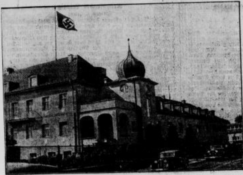
Feierliche Schlüsselübergabe in neuen Kaiser-Wilhelm-Institut für Physik Mit der feierlichen Schlüsselübergabe an den Leiter des Instituts, Professor Dr. Debye, wurde das neuerrichtete Kaiser-Wilhelm-Institut für Physik in Berlin-Dahlem, das über vorbildliche technische Einrichtungen verfügt und zu den modernsten Forschungstätten der Welt gehört, seiner

Bestimmung übergeben. Das Institut trägt den Namen des berühmten deutschen Physikers Max Planck. Einweisung der neuen österreichischen Landesregierung durch Reichsminister Dr. Fritsch Im historischen Saal des Wiener Kongresses, dem Gebäude der Reichskanzlei, nahm Reichsminister Dr.