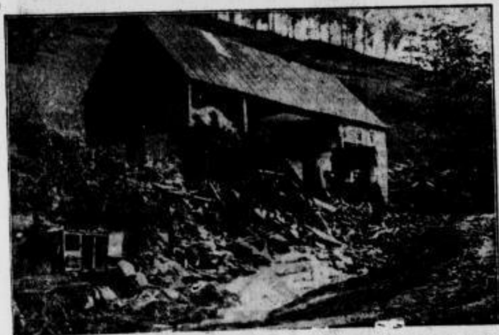
Die Unwetterkatastrophe im Egerland Ueber Hartmannsdorff im Egerland ging ein Wollenbruch mit Hagelschlag nieder, bei dem riesiger Schaden angerichtet wurde. Der kleine Ortswald verwandelte sich in einen reißenden Strom, der vier Häuser einriß und elf Scheunen wegschwemmte. Eine Frau sand in den Fluten den Tod. Die sudetendeutschen Brüder haben sofort eine große Hilfs-

aktion für die Geschädigten in die Wege geleitet. — Die verheerenden Fluten haben bei einem am Ortswald in Hartmannsdorff gelegenen Haus glatt die Vorderwand weggerissen. Hier wächst das stolze Werk der Volkswagenfabrik Das Werk der Arbeit erfüllt die Baupläne von Fellersleben am Mittelkanal. Bereits Ende 1939 sollen von