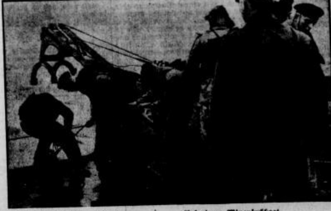
für die Volksernährung so wichtigen Arbeit nach. Eben hat dieser deutsche Fischdampfer die Rede gehalten und zieht nun Schwerbeladen nach der Heimat.