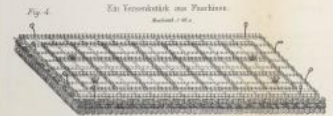
Kais Verankerung am Poldersee.