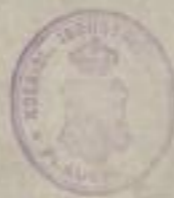
gravé par C. A. de Longlée