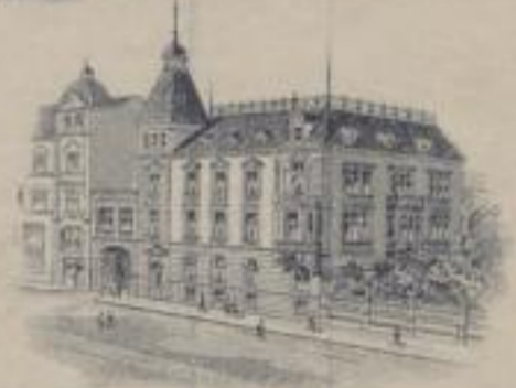
Geschäfts-Haus AUE in Sachsen. Fernsprecher N° 9 u. 50. Telegramm-Adr. Wolle Aue Erzgeb.