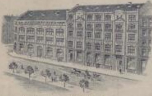
Geschäfts-Haus BERLIN C. Bischofsstrasse 19/21.

Telegr.-Adr. Damasthaus. Fernsprecher Amt I, N° 8343.