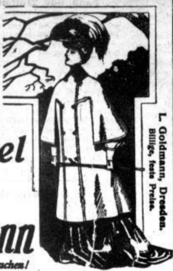
L. Goldmann, Dresden. Billige, feste Preise.