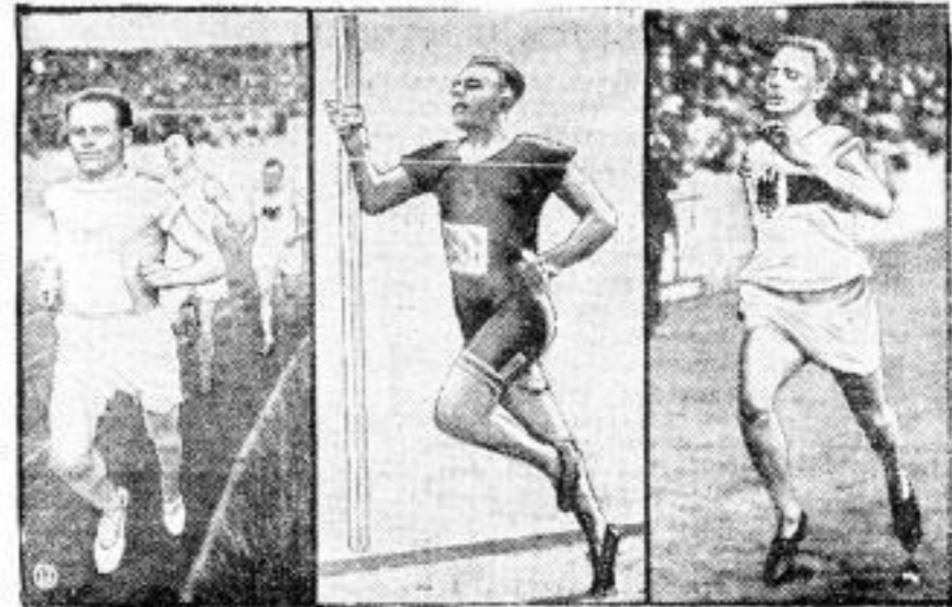
Der Sturz der Weltrekorde.

Bei den diesjährigen Manövern der Reichswehr wurden außerordentlich interessante Schwimmübungen der Kavallerie vorgenommen. Unser Bild zeigt einen interessanten Moment mitten aus den Kampfübungen, der Inspekteur der Kavallerie General von Posok rechts im Vordergrund mit seinem Stabe beim Durchqueren des Stromes.