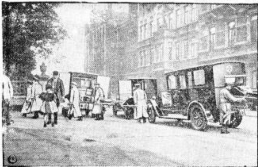
Die Typhusepidemie in Hannover