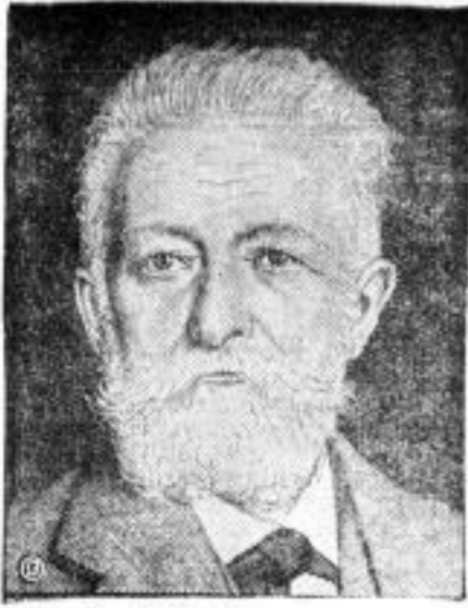
Prof. Rudolf Carnap

Der Senior der deutschen Philosophen, der am Mittwoch im Alter von 81 Jahren in Jena, wo er als Universitätslehrer amtierte, gestorben ist.