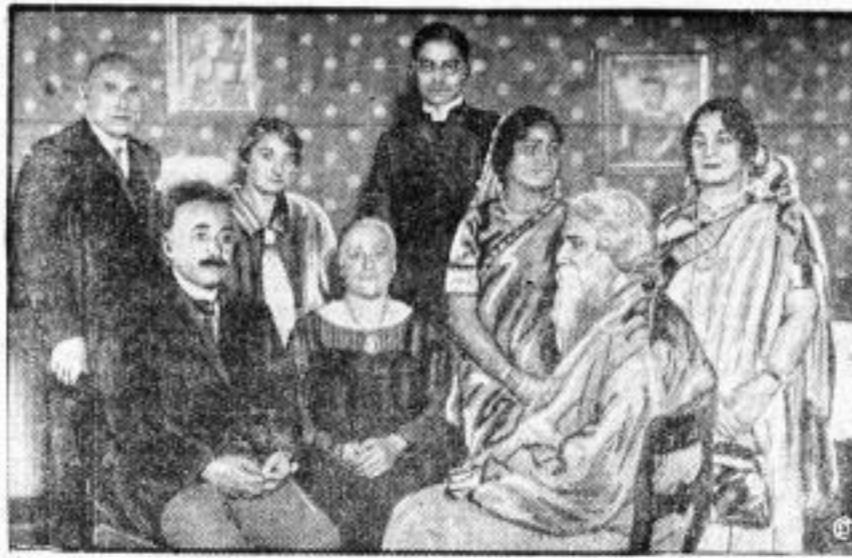
Rabindranath Tagore bei Einstein.

Der Senior der deutschen Philosophen, der am Mittwoch im Alter von 81 Jahren in Jena, wo er als Universitätslehrer amtierte, gestorben ist.