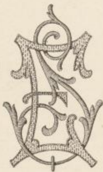
Fig. 224 a.