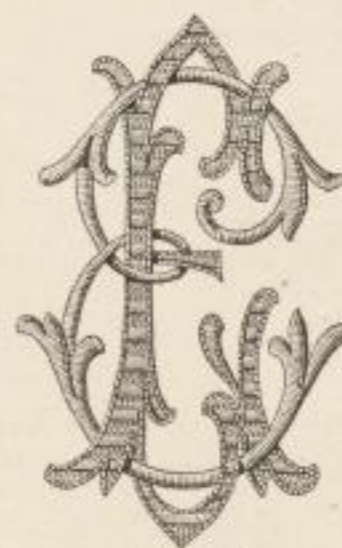
Fig. 225 b.

gegen entweder ganz in roth in Hochstickerei ausgeführt, oder es wird nach Abb. Nr. 220 blos ein Buchstabe roth gestickt und der zweite in weiss gehalten.