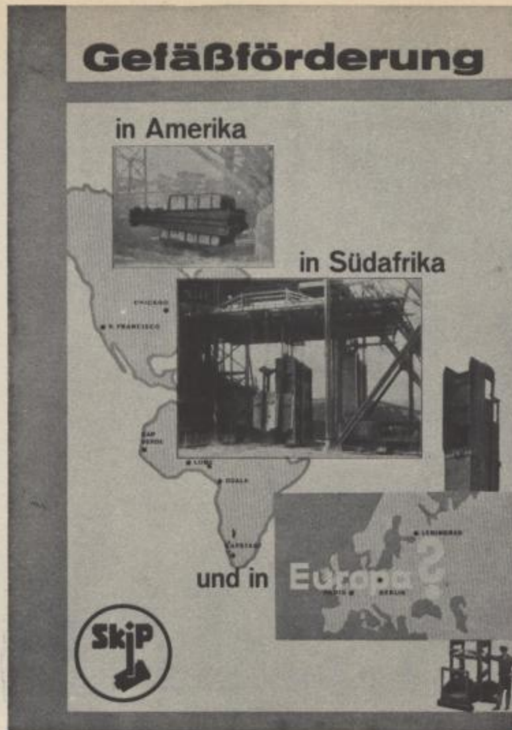
Abb. 290. In Anlehnung an die Entwurfsidee 289 entwickelte sich die endgültige Titelseite „Gefäßförderung in Amerika . . . in Südafrika . . . und in Europa?“