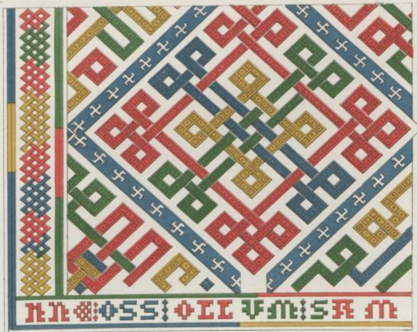
1. 2. 3. 4. 5. 6. Aegyptische Ornamente an Decken u. Wänden der Gräber. 7. Skandinavisches Stickmuster.