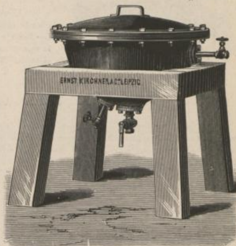
Telegraf: VH. „Veronica“.

Questo apparecchio si compone di due caldaie, l'una di ferro fuso e di forma emisferica, l'altra di rame ed attaccata in quella. Il vapore che fa bollire la colla circola tra le due caldaie. L'apparato offre dunque sicurezza assoluta contra i pericoli d'incendio. Due valvole da isolare il vapore ed un robinetto da travasare la colla vengono forniti da noi allo stesso tempo; una valvola di sicurezza però, soltanto dietro ad ordine speciale.