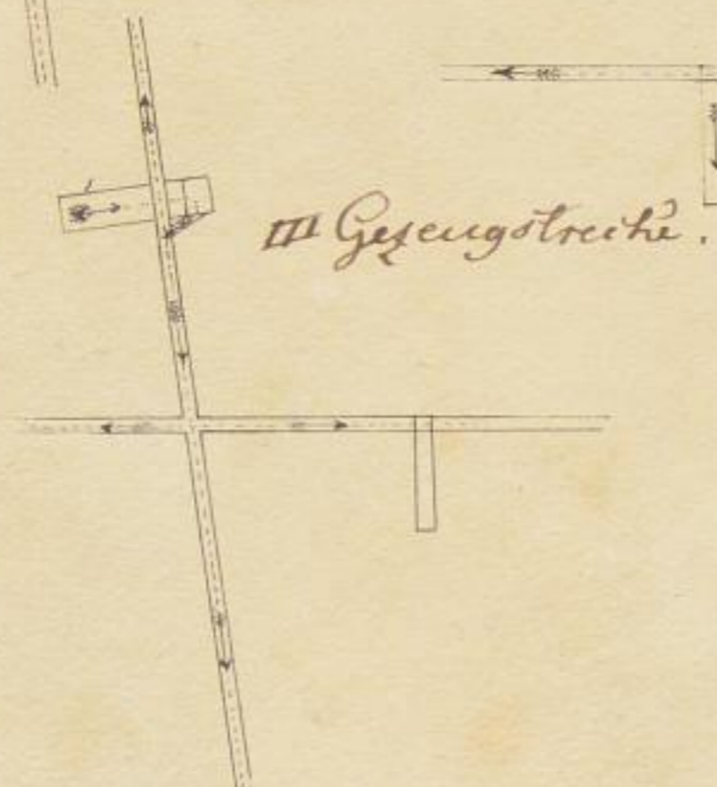
Grundriß eines Theils des Stollens, der zweiten, dritten und vierten Gezeugstrecke des Grubengebäudes Beschehrt Glück.