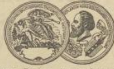
Ehren-Diplom Amsterdam 1883 Höchste Auszeichnung.