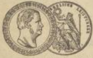
Große goldene Staats-Medaille Düsseldorf 1880.