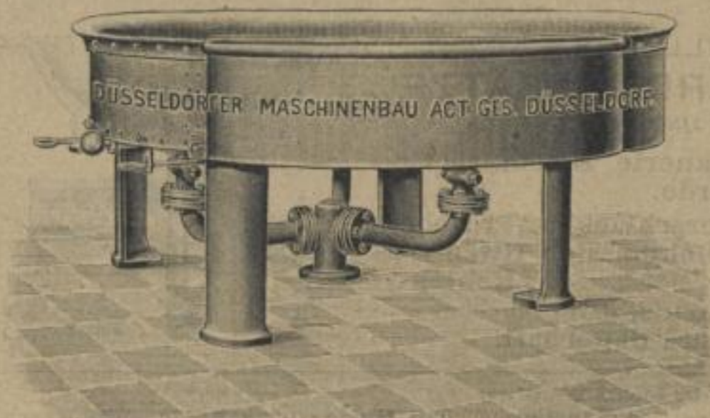
Mod. C. Rundherd mit drei Seitendüsen und Löschtrog.