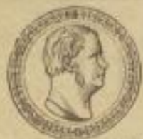
Kgl. preufs. gold. Staatsmedaille.

Rud. Meyer in Mülheim a. d. Ruhr, Maschinenfabrik. 200