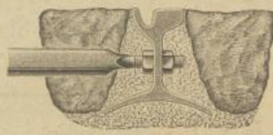
Rillenschiene mit gebogenem Fufse.

Eisenbahn-, Pferdebahn- und Grubenschienen. Schwellen und Laschen.