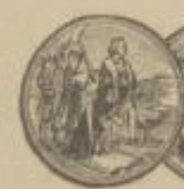
Höchster Preis und Auszeichnung Chicago 1893.