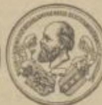
Goldene Medaille Amsterdam 1883.