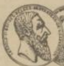
2 goldene Medaillen Antwerpen 1885.