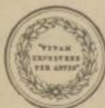
Erster Preis Melbourne 1880.