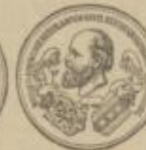
Goldene Medaille Amsterdam 1883.