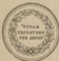
Erster Preis Melbourne 1880.