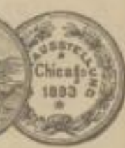
Höchster Preis und Auszeichnung Chicago 1893.