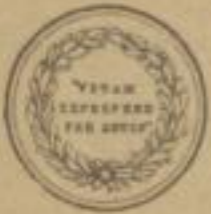
Erster Preis Melbourne 1880.