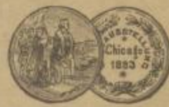
Höchster Preis und Auszeichnung Chicago 1893.