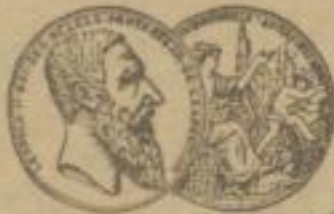
2 goldene Medallien Antwerpen 1885.