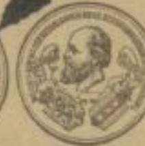
Goldene Medaille Amsterdam 1883.