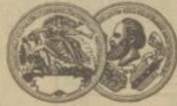
Ehren-Diplom Amsterdam 1883 Höchste Auszeichnung.