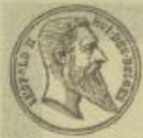
Goldene Medaille für Hydraulik, Antwerpen 1894.