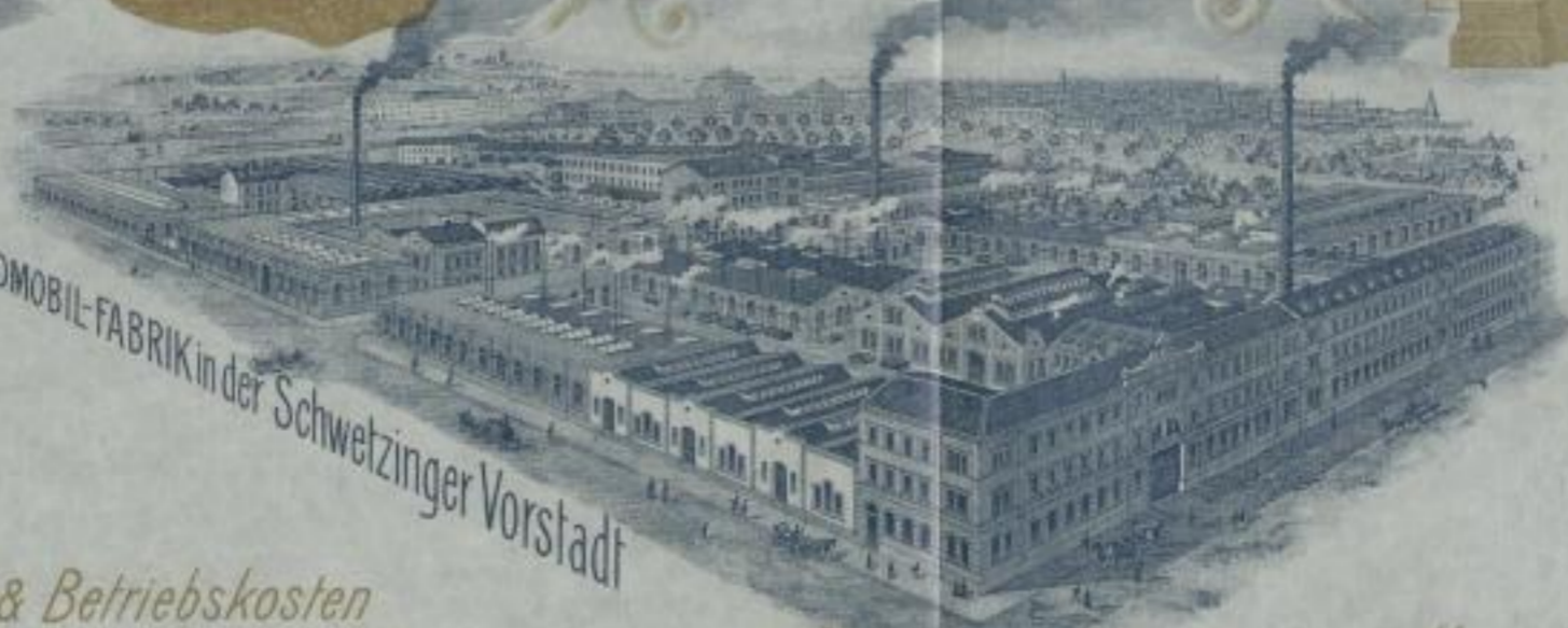
Ansicht der LOKOMOBIL-FABRIK in der Schwetzinger Vorstadt

In Anlage & Betriebskosten nachweislich erheblich billiger wie stationäre Anlagen mit eingemauerten Kesseln bei mindestens gleicher Leistungsfähigkeit. Dauerhaftigkeit und Betriebssicherheit.