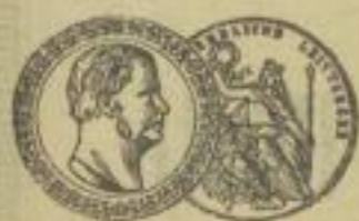
Große goldene Staats-Medaille Düsseldorf 1880.