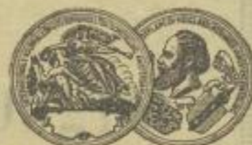
Ehren-Diplom Amsterdam 1883 Höchste Auszeichnung.