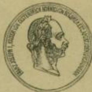
Verdienst - Medaille