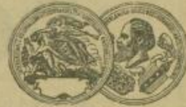
Ehren-Diplom Amsterdam 1883 Höchste Auszeichnung.