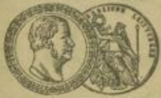
Große goldene Staats-Medaille Düsseldorf 1889.