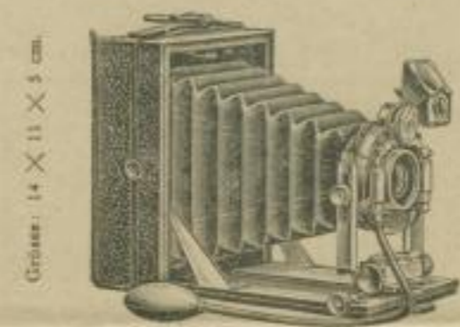
Grösse: 14 × 11 × 35 cm.

für Platten 9 × 12 cm u. tageslichtladende Flachfilm 8 × 10 1/2 cm.