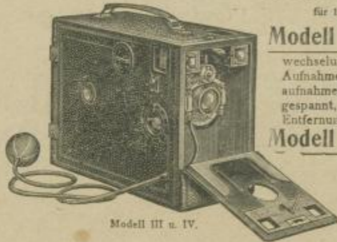
Modell III u. IV.

für 12 Platten 9 × 12 cm. Grösse: 11 × 19 × 24 1/2 cm. Gewicht: 1830 gr.