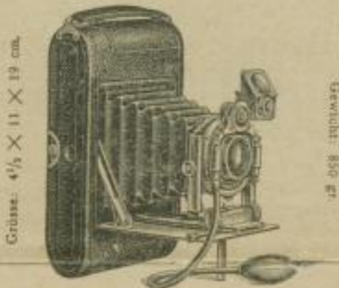
Grösse: 4 1/2 × 11 × 19 cm.

für Rollfilm 8 × 10 1/2 cm, Platten und Flachfilm 9 × 12 cm.