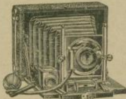
Modell I und III.

Platten-Camera in aussergewöhnlich eleganter Ausführung.