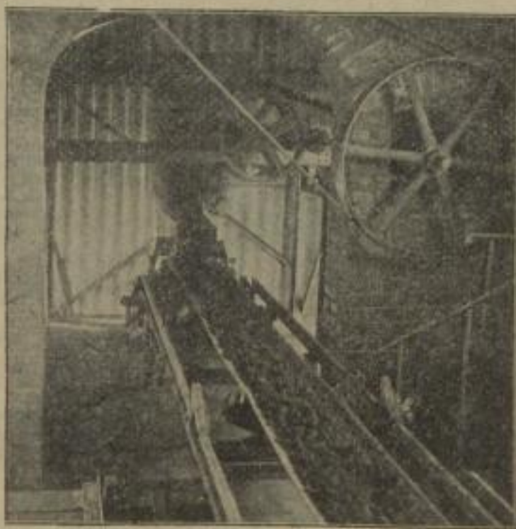
Ueber 100 Anlagen im Betriebe.

MUTH-SCHMIDT G. m. b. H., Berlin Hafenplatz 4.