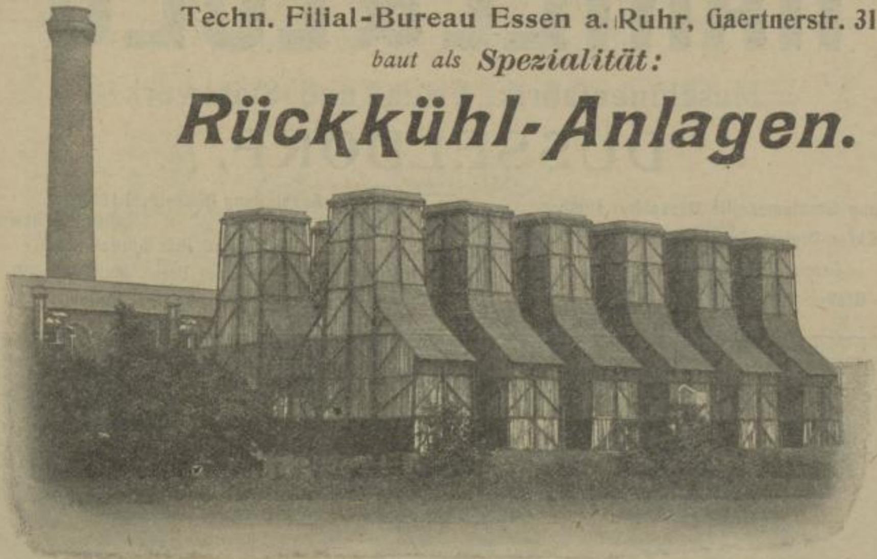
Kühlanlage, ausgeführt für die Elektrische Kraftstation der Metropolitan Railway Co., Neasden b. London. 7000 cbm Wasser pr. Stunde.