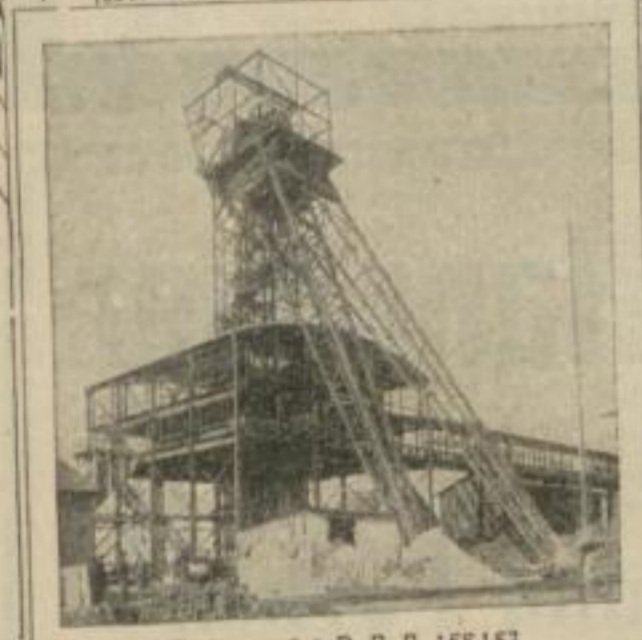
Fördergerüst D. R. P. 158.157 für die Bergwerks-Gesellschaft Auguste Viktoria, Sinsen 5 weitere Gerüste im Bau