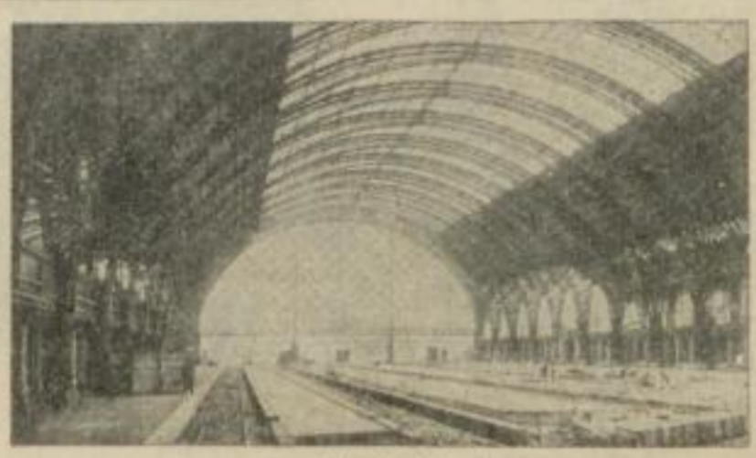
Hauptbahnhof Dresden Spannweite 59 m, Länge 180 m, Scheitelhöhe 30 m, Gewicht 8.700.000 kg