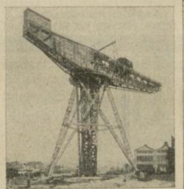
Eisenkonstruktion zu einem Drehkran v. 150 t Tragkraft für die Krupp'sche Germania-Werft, Kiel Konstruiert und ausgeführt für die Duisburger Maschinenbau-R.-G.