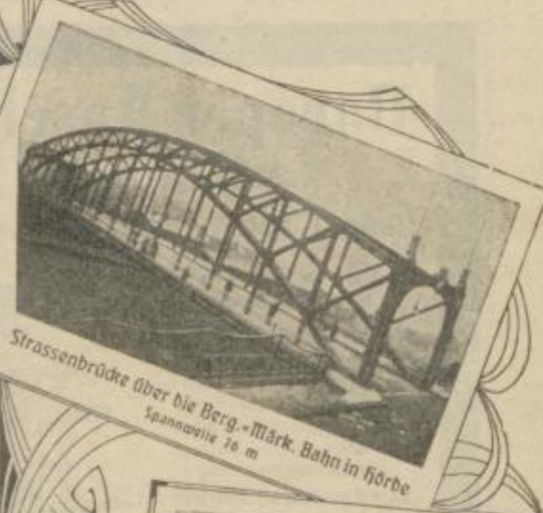
Strassenbrücke über die Berg.-Märk. Bahn in Hörde Spannweite 76 m