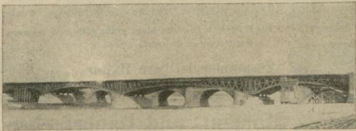
Viergeleisige Eisenbahnbrücke über die Elbe bei Dresden Spannweite: Öffnung I 37,6 m, Öffnung II-IV je 65,75 m, Öffnung V 24 m - Gesamtlänge der Eisenkonstruktion 238,85 m, Gesamtbreite 19,6 m, Totalgewicht 4.750.000 kg