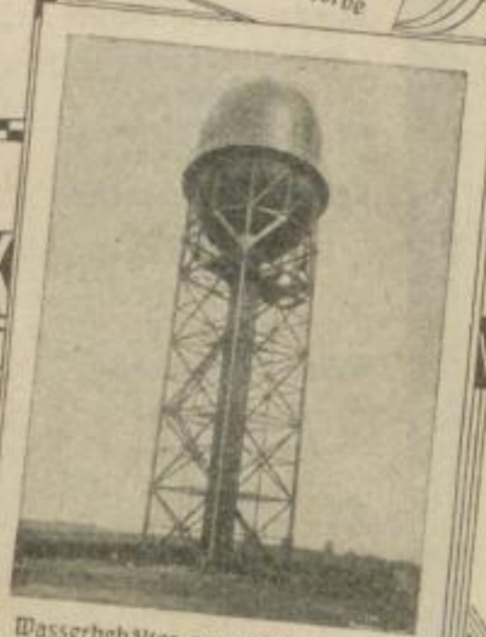
Wasserbehälter von 2000 cbm Inhalt auf 35 m hohem, eisernem Unterbau, Gesamthöhe 57 m für das Wasserwerk bei Stahl-Uring