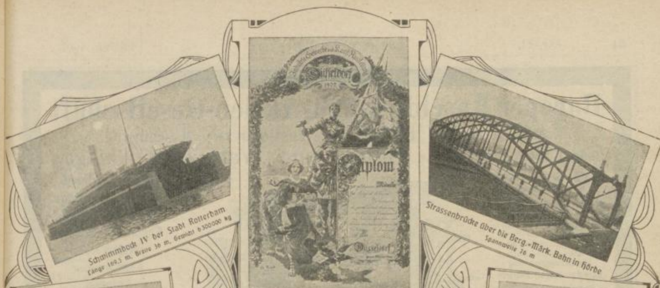
Schwimmböck IV der Stadt Rotterdam Länge 169,5 m, Breite 36 m, Gewicht 8.300.000 kg