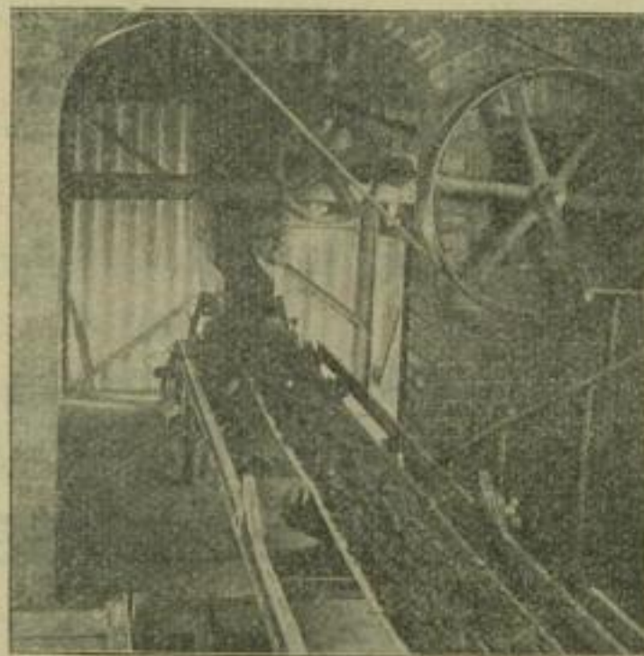
Ueber 100 Anlagen im Betriebe.

MUTH-SCHMIDT G. m. b. H., Berlin Hafen- platz 4.