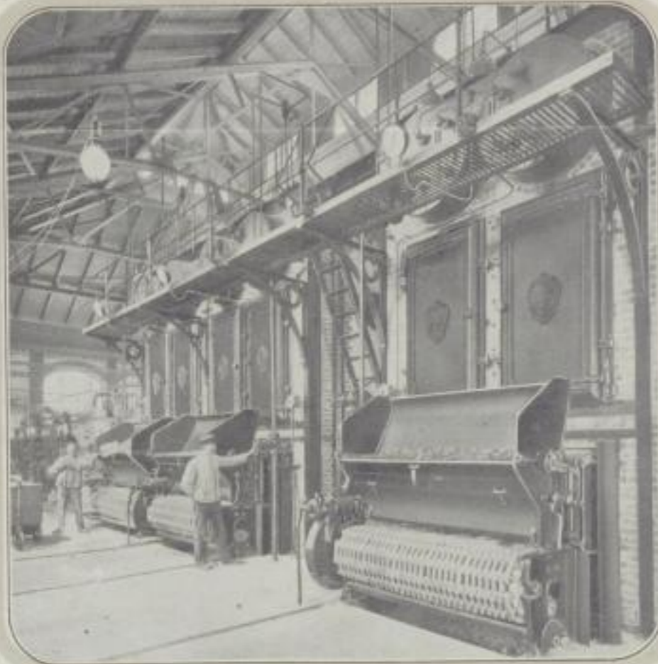
Landesversicherungsanstalt Berlin, Heilstätte Beelitz-Mark. ■ Drei Babcock & Wilcox Patent-Wasserrohr-Dampfkessel von je 200 qm Heizfläche, mit Überhitzern und Kettenrosten.