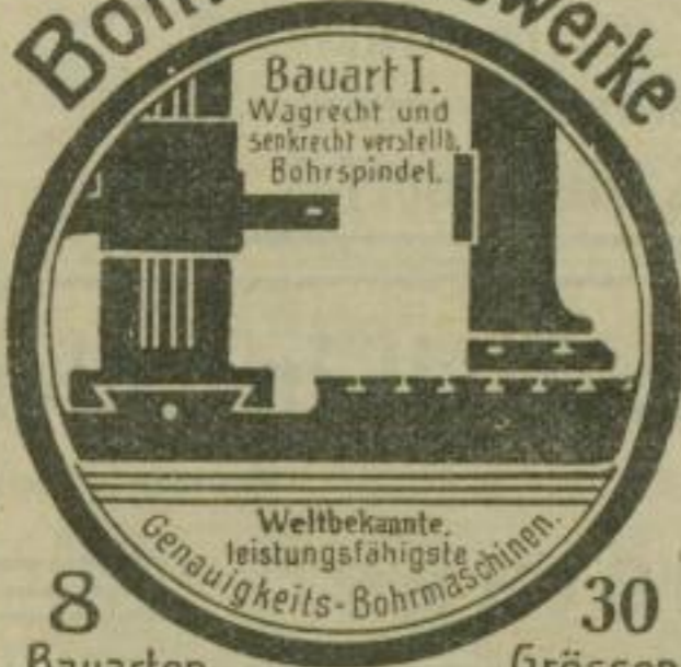
Bauart I. Wagrecht und senkrecht verstellb. Bohrspindel.

Weltbekannte, leistungsfähigste Genauigkeits-Bohrmaschinen.