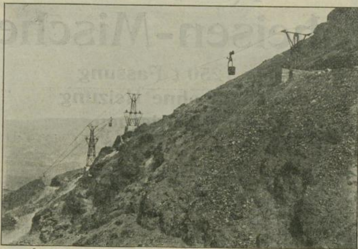
Drahtseilbahn der Zinngrube „Maria Luciana“ bei Huanuni, Bolivien.