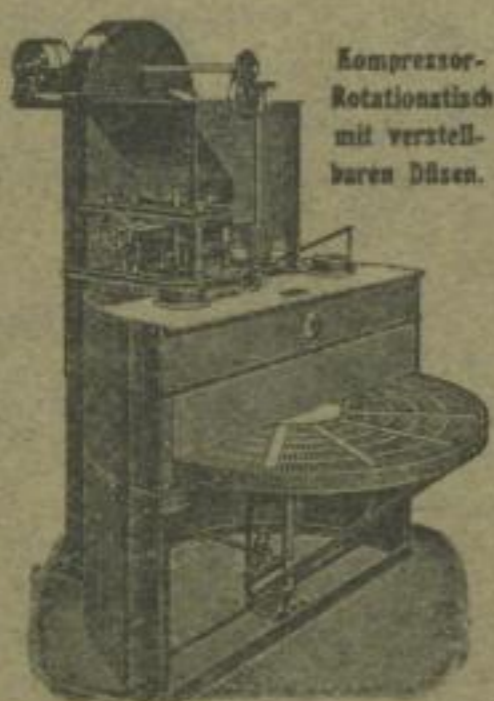
Kompressor- Rotationstisch mit verstell- baren Düsen.