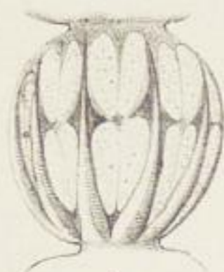
Fig. 4 a .