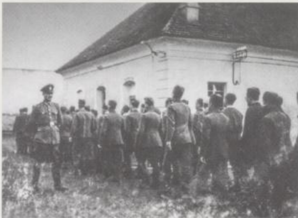
Häftlinge des Polizeigefängnisses der Gestapo in der Kleinen Festung Theresienstadt

Die Kleine Festung diente den Nationalsozialisten seit Juni 1940 als Außenstelle des Prager Gestapo-Gefängnisses Pankrác. Insgesamt 27 000 Männer und 5 000 Frauen, vornehmlich Tschechen, durchliefen das Gefängnis. Viele von ihnen waren politische Häftlinge, tschechische Patrioten und Widerstandskämpfer. Aber es gab auch inhaftierte Juden und Kriegsgefangene aus verschiedenen Ländern. Neben zahlreichen, der Gewalt und den widrigen Bedingungen geschuldeten Opfern war die Kleine Festung Hinrichtungsort für 300 Menschen.