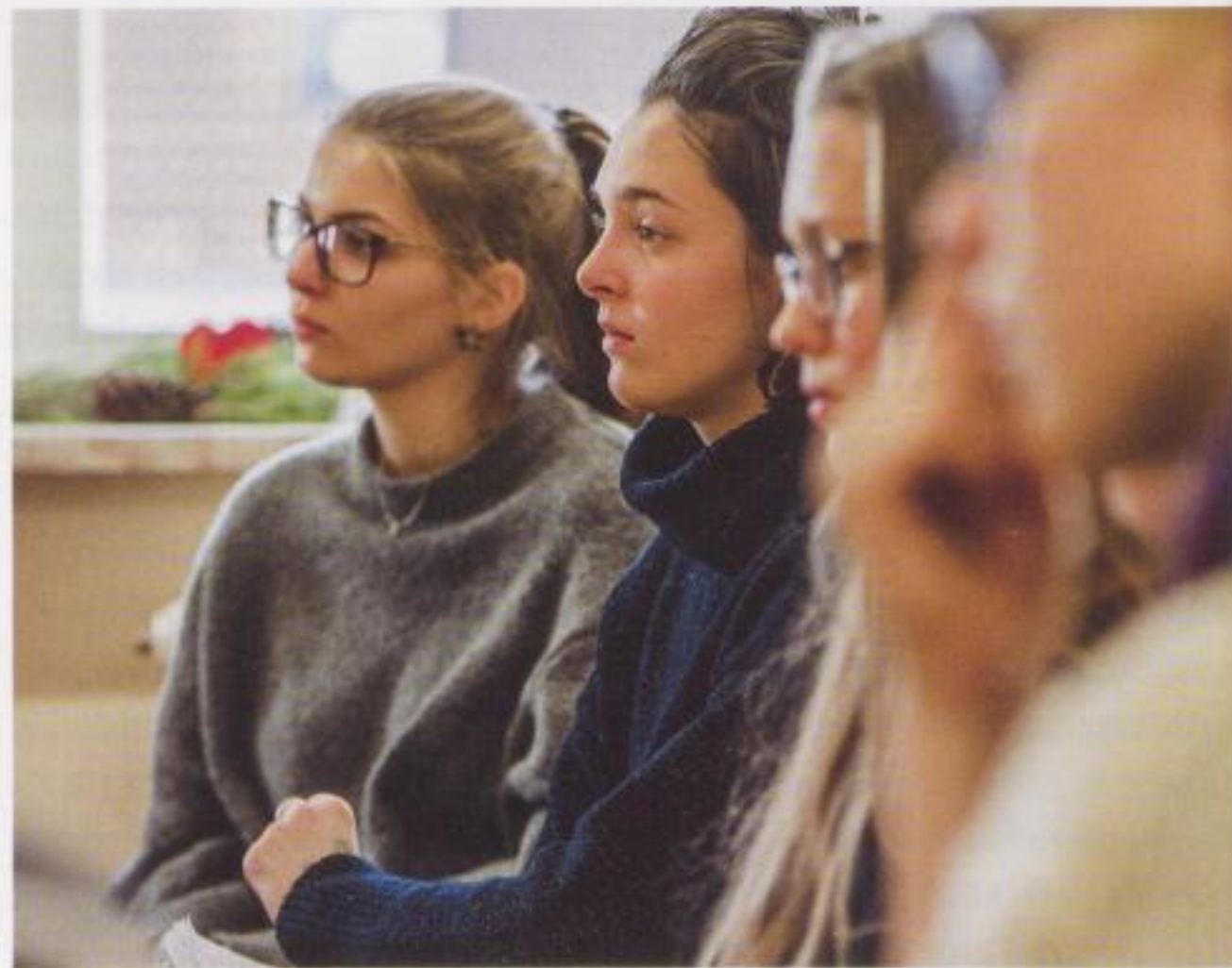
| 24 | Vorbereitungstreffen