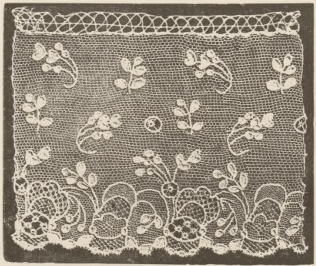
POINT DE BURANO

Fabriqué par l'École du point de Burano. (Exposition Universelle de 1878.)