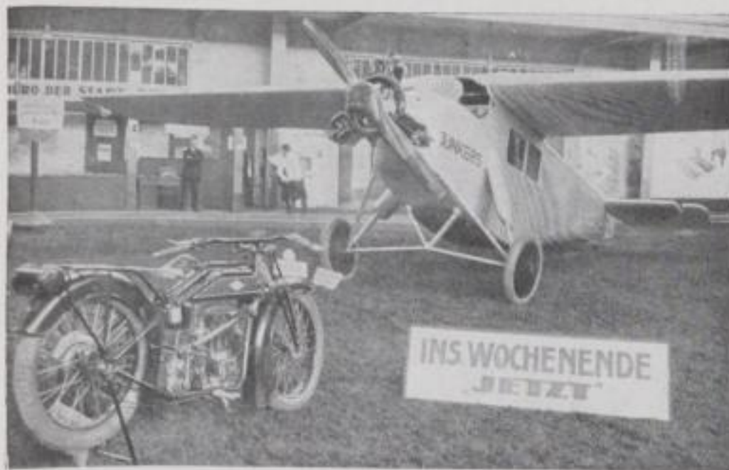
6. Nach den vorstehenden Bildern wirkt es wie ein Schlag ins Gesicht, wenn auf einer Wochenend-Ausstellung Flugzeug und Motorrad als die besten Beförderungsmittel für den Durchschnittsbürger angepriesen werden. Es wäre erbärmlich, wenn man die größere Aufgabe geflissentlich übersehen wollte!