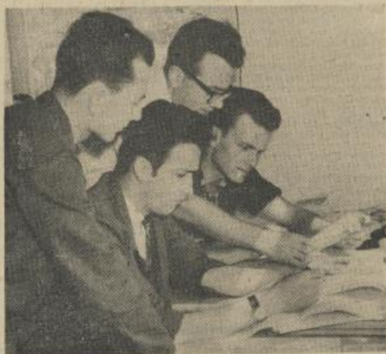
Physikstudenten helfen im Studentensommer dem Betrieb im Rahmen ihres „Jugendobjektes Wissenschaft“ bei der Lösung wichtiger wissenschaftlich-technischer Probleme