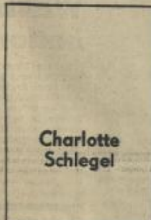
41 Jahre Kaderinstrukteur