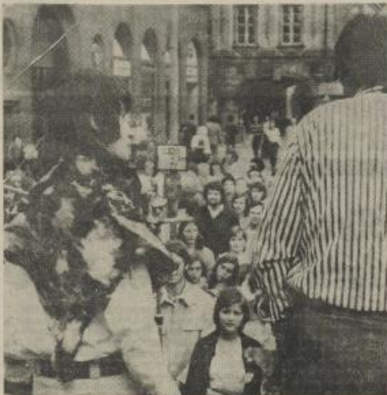
IN DEN LETZTEN WOCHEN spielten die „academixer“ mehrmals im Zentrum Leipzigs auf dem Theaterkarren der Kulturdirektion. Anlaß waren die Tage der Volkskunst und der 25. Jahrestag unserer Republik.