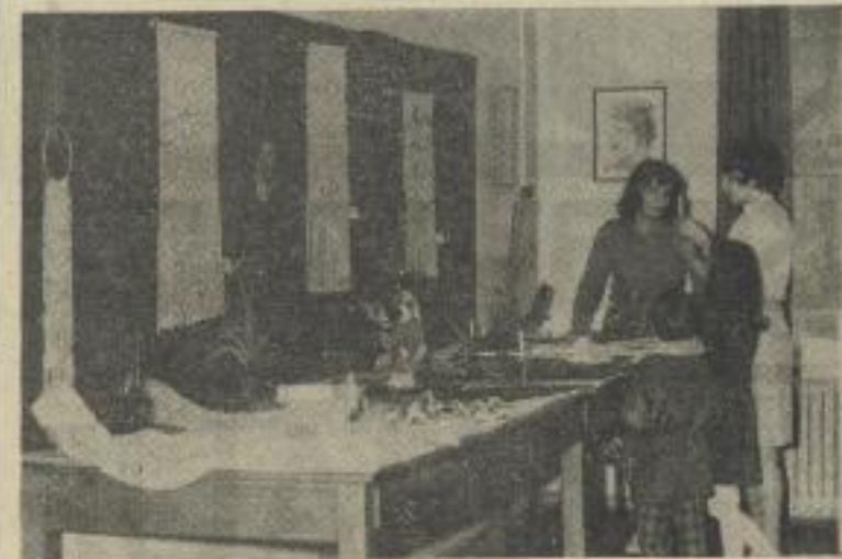
Die Sektion Biowissenschaften veranstaltete ihren IV. volkskünstlerischen Wettbewerb in Vorbereitung des zentralen Wettbewerbs der KMU. Die Ausstellung, die am 6. April vom Sektionsdirektor eröffnet wurde, fand reges Interesse...