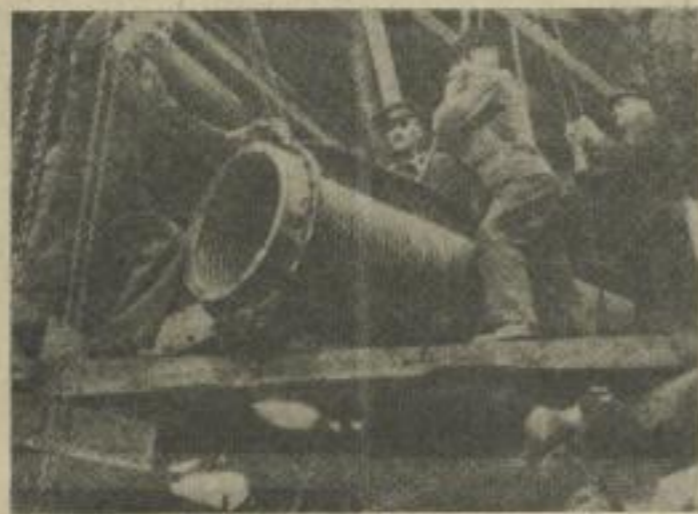
Mit Elan gingen die Genossen den Arbeitern beim Wiederaufbau der Wirtschaft voran und befähigten die Arbeiterklasse, ihre Macht zu verwirklichen.