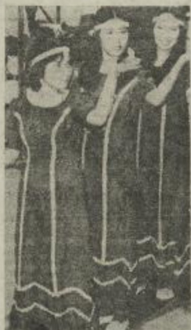
Mit einer Solidaritätsveranstaltung - gestaltet vom Ensemble „Solidarität“ der KMU - findet das „Fest junger Künstler“ seinen Abschluß.