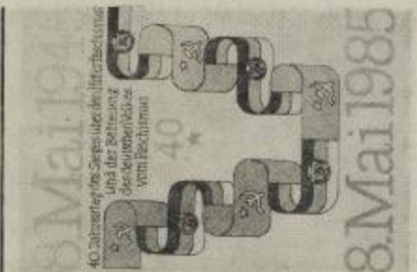
40. Jahrestag des Sieges über die Hitlerherrschaft und der Befreiung des europäischen Volkens vom Faschismus

Begegnung von FDJ-Studenten an Kommisoldaten Zeit: 19 Uhr Ort: "mb"