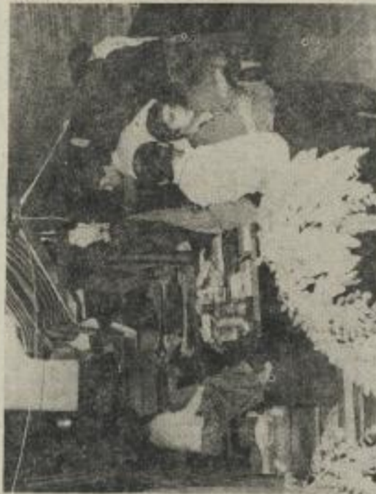
TREFFEN MIT FREUNDEN, Sowjetische Kommernoten zu Gast in der "mb"