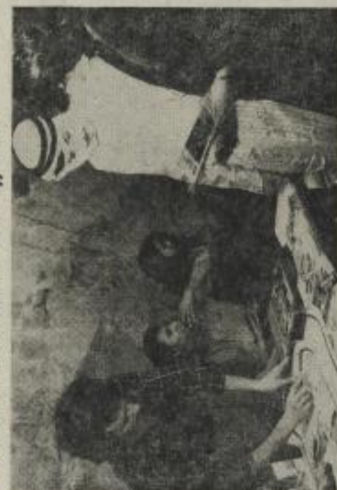
„Friedensfest“ in der Moritzbastei - Solibasar, Musik und Tanz sind Aus- druck des völkerverbindenden Charakters dieses Festes.